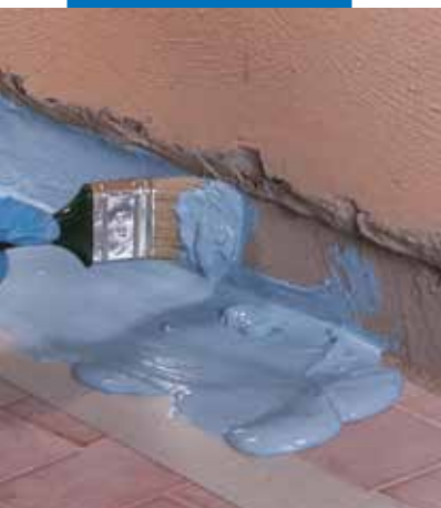
Application au pinceau, de Mapelastic AquaDefense à la jonction sol/mur, avant l'application de Mapeband PE 120