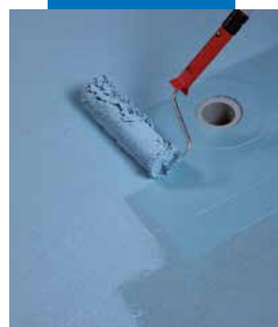
Application au rouleau de la seconde passe de Mapelastc AquaDefense

Valeurs d'adhérence selon EN 14891 obtenues avec Mapelastc AquaDefense et un mortier colle type C2 conformément à la norme EN 12004.