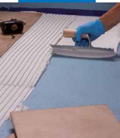
Collage des carreaux sur Mapelastic AquaDefense