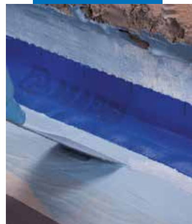
Application de Mapeband dans la jonction sol/mur avec Mapelastc AquaDefense