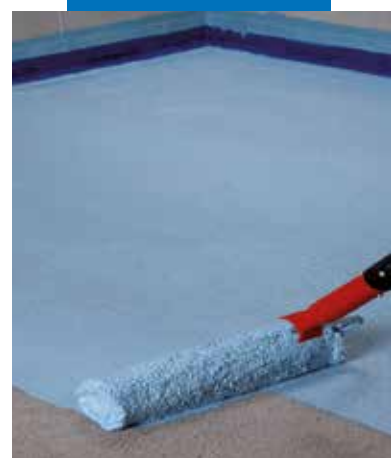
Application de la première passe de Mapelastc AquaDefense sur chape